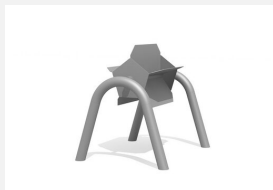
SW.146.11 Wasserrad offen mit Doppelbogen