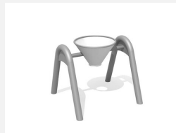
SW.146.40 Kippeimer mit Doppelbogen