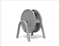
SW.146.31 Wasserrad geschlossen mit Doppelbogen