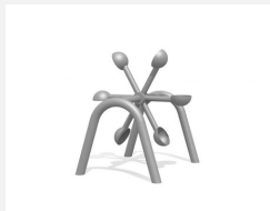
SW.146.20 Löffelrad 6 klein mit Doppelbogen