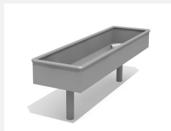
SW.141.40 Wasserbecken 150 x 40