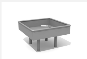
SW.141.41 Wasserbecken 80 x 80