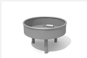
SW.141.31 Wasserbecken rund