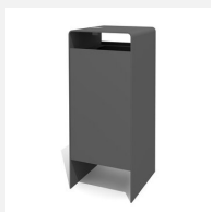
AB.041.21.A Verso quader 100 L mit Ascher color