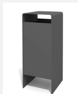
AB.041.21 Abfallbehälter Verso quader