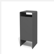
AB.041.11 Abfallbehälter Verso quader 50 L