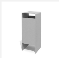
AB.041.10 Abfallbehälter Verso quader 50 L