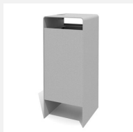
AB.041.20.A Verso quader 100 L mit Ascher