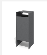
AB.041.11.A Abfallbehälter Verso quader