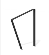
DI.108.16.C Fahrradbügel Areo 65.1 color