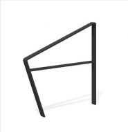
DI.108.29.C Fahrradbügel Areo 95.2 color