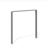
DI.107.18 Fahrradbügel Quo 85.1