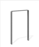
DI.107.15 Fahrradbügel Quo 55.1