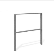
DI.107.28 Fahrradbügel Quo 85.2