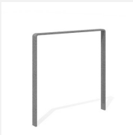
DI.107.18 Fahrradbügel Quo 85.1