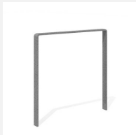
DI.107.18 Fahrradbügel Quo 85.1