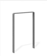
DI.107.15 Fahrradbügel Quo 55.1