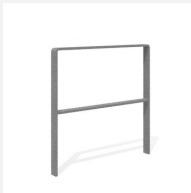
DI.107.28 Fahrradbügel Quo 85.2