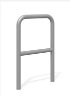
DI.106.25.I Fahrradbügel Tube 55.2