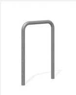
DI.106.15 Fahrradbügel Tube 55.1