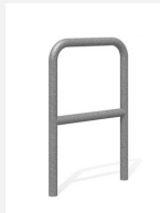
DI.106.25 Fahrradbügel Tube 55.2