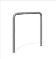
DI.106.18 Fahrradbügel Tube 85.1