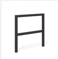
DI.105.28.C Fahrradbügel Pura 85.2 color