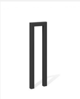
DI.105.12.C Fahrradbügel Pura 25.1 color