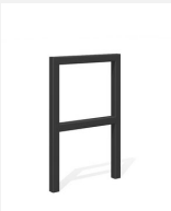
DI.105.25.C Fahrradbügel Pura 55.2 color