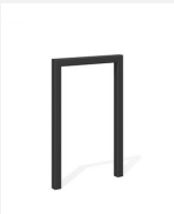
DI.105.15.C Fahrradbügel Pura 55.1 color