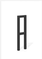
DI.105.22.C Fahrradbügel Pura 25.2