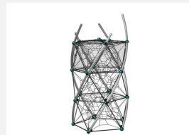
B90.295.025 DNA Tower XL.03