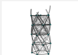
B90.295.014 DNA Tower L.04