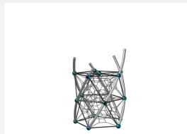
B90.295.024 DNA Tower XL.02