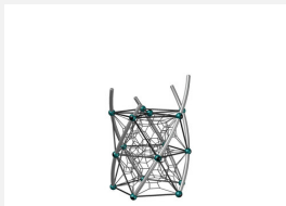
B90.295.012 DNA Tower L.02