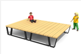
MO.17.90 Camp Jugendbank Kombi nach Projekt