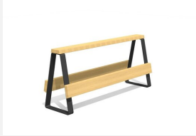
MO.17.46 Dynamisch und modular.<br>Sitzfläche in