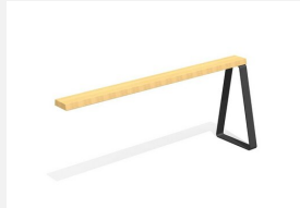
MO.17.49.A Camp Hochsitz, Add-on