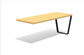
MO.17.47.A Camp Tisch, Add-on