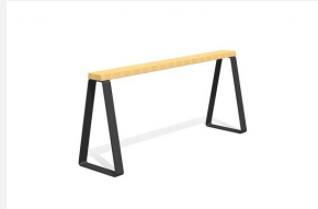
MO.17.49 Dynamisch und modular.<br>Sitzfläche in