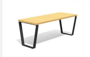
MO.17.47 Dynamisch und modular.<br>Sitzfläche in