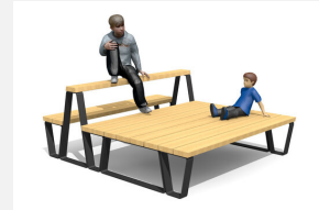
MO.17.50 Camp Jugendbank Kombi 5