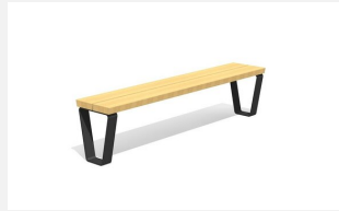
MO.17.43 Dynamisch und modular.<br>Sitzfläche in FSC-