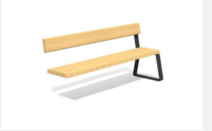
MO.17.44.A Camp Bank, Add-on