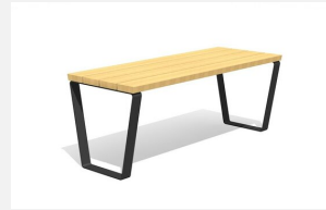
MO.17.47 Dynamisch und modular.<br>Sitzfläche in