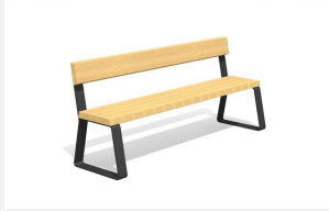
MO.17.44 Dynamisch und modular.<br>Sitzfläche in