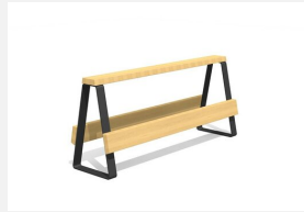
MO.17.46 Dynamisch und modular.<br>Sitzfläche in