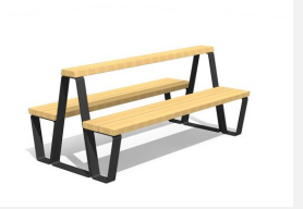
MO.17.45 Dynamisch und modular.<br>Sitzfläche in