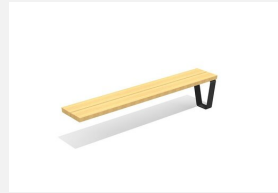
MO.17.43.A Camp Adapterbank 39 cm tief, Add-on