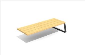
MO.17.42.A Camp Hockerbank 80 cm tief, Add-on