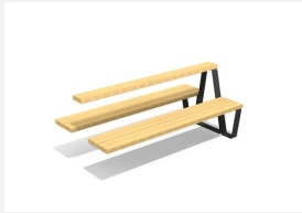
MO.17.45.A Camp Jugendbank Kombi 3, Add-on