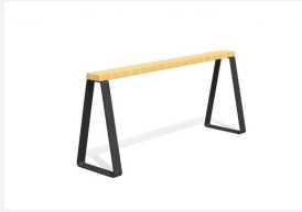
MO.17.49 Dynamisch und modular.<br>Sitzfläche in