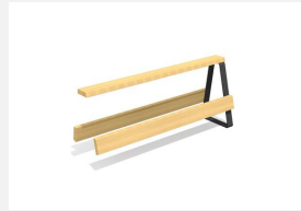
MO.17.46.A Camp Jugendbank, Add-on