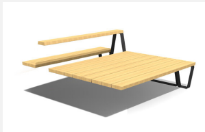
MO.17.50.A Camp Jugendbank Kombi 5, Add-on