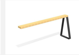
MO.17.49.A Camp Hochsitz, Add-on