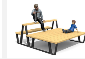
MO.17.50 Camp Jugendbank Kombi 5