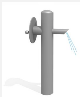
SW.134.1 Drehpumpe 2