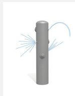
SW.135.3 Wasserspritzer 3 mit Trinkdüse