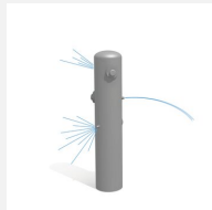
SW.135.2 Wasserspielsäule 2