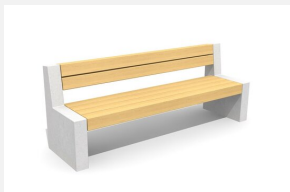
BT.151.B.22 Bank Versi Beton 220