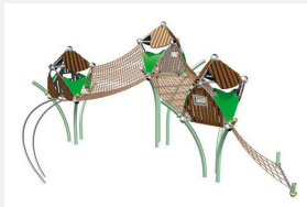
B90.293.039 Greenville Combi.039