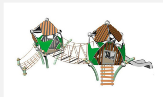
B90.293.102 Greenville Combi.102