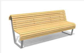
BT.070.B Areo Bank