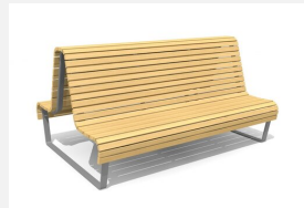
BT.070.BHD Areo Doppelbank hoch