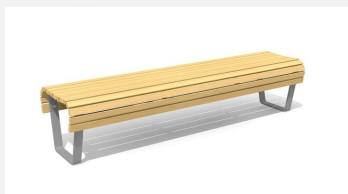
BT.070.H Areo Hockerbank