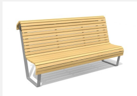
BT.070.BH Areo Bank hoch