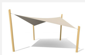
WS.010.9.R Sonnensegel nach Mass nature