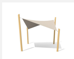
WS.010.3.R Sonnensegel 3 x 3 m nature