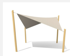
WS.010.5.R Sonnensegel 5 x 5 m nature