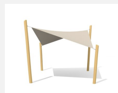
WS.010.4.R Sonnensegel 4 x 4 m nature