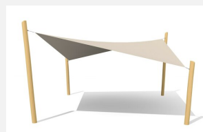
WS.010.6.R Sonnensegel 6 x 6 m - nature