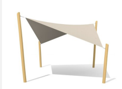
WS.010.5.R Sonnensegel 5 x 5 m nature