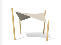
WS.010.4.R Sonnensegel 4 x 4 m nature