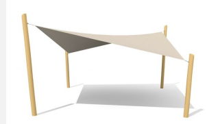
WS.010.6.R Sonnensegel 6 x 6 m - nature