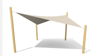
WS.010.9.R Sonnensegel nach Mass nature