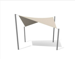
WS.010.4 Sonnensegel 4 x 4 m