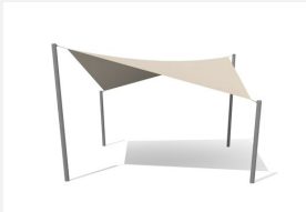
WS.010.5 Sonnensegel 5 x 5 m