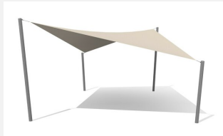
WS.010.9 Sonnensegel nach Mass