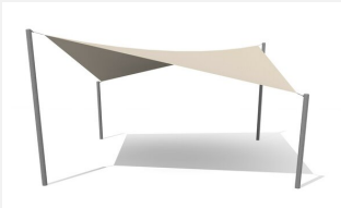
WS.010.6 Sonnensegel 6 x 6 m