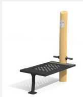
UF.6416.R Bauchtrainer nature