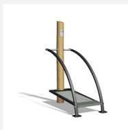
UF.6015.R Renner nature