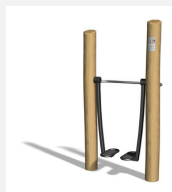
UF.6019.R Geher nature