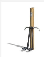
UF.6017.R Beinwelle nature