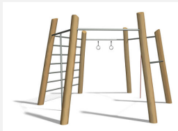
TF.7020.R Multigym nature