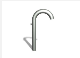
SW.132.3 Wasserspender in Edelstahl