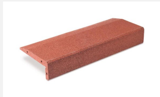
SW.022.1 Sandkastenwinkel 100 x 40 x 14 cm