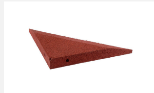
SW.022.2 Sandkastenwinkel Ecke