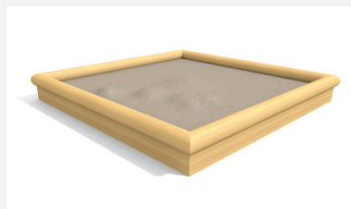
SW.014.30.R Sandkasten Hoch 3 x 3 m - nature