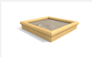
SW.014.20.R Sandkasten Hoch 2 x 2 m - nature