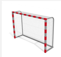
SP.041.2 Kleinfeldtor freistehend rot