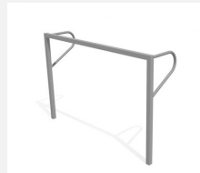
SP.042.1 Kleinfeldtor - feste Montage