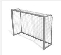
SP.041.1 Kleinfeldtor freistehend Alu