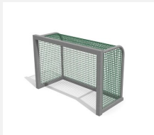
SP.040.2 Street Tor 180 x 120 cm