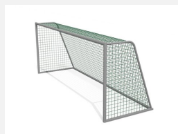
SP.044.1 Jugend Fussballtor