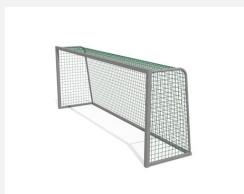
SP.043.1 Jugend Fussballtor - Freistehend