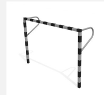
SP.042.2 Kleinfeldtor - feste Montage