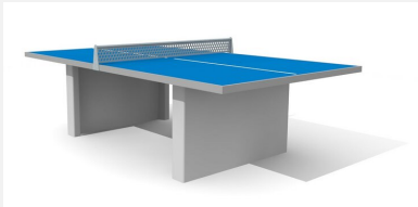
SP.010.12.B Tischtennis Polymerbeton blau