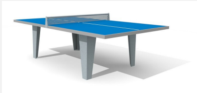
SP.010.11.B Tischtennis Polymerbeton, Stahlgestell blau