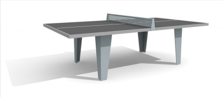
SP.010.11.A Tischtennis Polymerbeton, Stahlgestell anthrazit