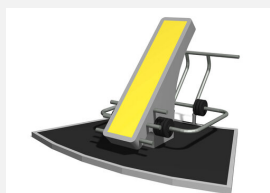
SF.1308 Rückentrainer sportfit m. Bodenplatte