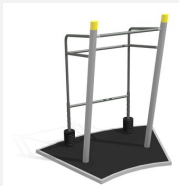
SF.1314 Gewichtheber m. Bodenplatte