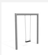
SC.160.1 1er Quaderschaukel