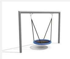
SC.162.3 Das Nest im Quader