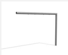
SC.160.09 2er Anbauelement (exkl. Einhängeteile)