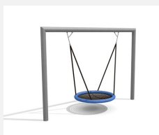
SC.162.3 Das Nest im Quader