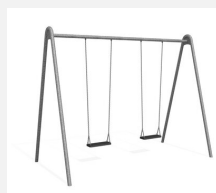
SC.121.2 2er Metallschaukel verzinkt