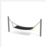
SC.110.3 Komfort Hängematte