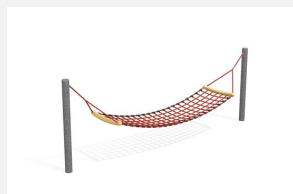
SC.110 Hängematte Simple