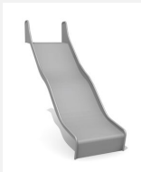
RU.090.20.W.B bimbo Wellenrutsche