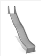
RU.090.20.W bimbo Wellenrutsche