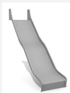
RU.090.25.W.E bimbo Wellenrutsche