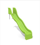
RU.010.15.W Hangrutsche mit Welle - H 150 cm