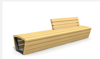
MO.17.02.R Bank Cado corpus m. Teilrückenlehne 3 m rechts