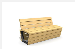
MO.17.06 Bank Cado corpus mit Rückenlehne 1.55 m