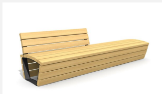
MO.17.02.L Bank Cado corpus m. Teilrückenlehne 3 m links