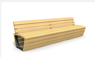
MO.17.03 Bank Cado corpus mit Rückenlehne 3 m