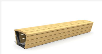
MO.17.01 Bank Cado corpus ohne Lehne 3 m