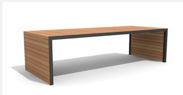
MO.14.32.3 Tisch Linar 300 cm / 120 cm