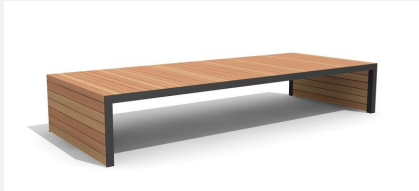
MO.14.24.3 Hockerbank Linar 300 x 200 cm