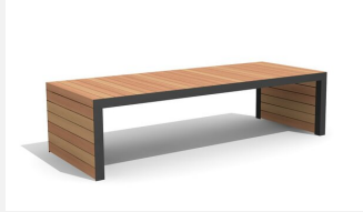
MO.14.23.2 Hockerbank Linar 200 cm / 80 cm