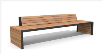
MO.14.21.3 Bank Linar 300 cm