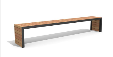
MO.14.22.3 Hockerbank Linar 300 cm / 45 cm