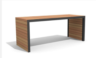
MO.14.31.2 Tisch Linar 200 cm / 80 cm