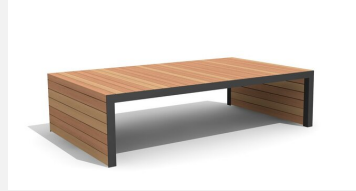
MO.14.24.2 Hockerbank Linar 200 x 120 cm