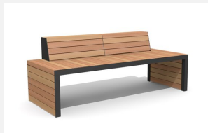
MO.14.21.2 Bank Linar 200 cm