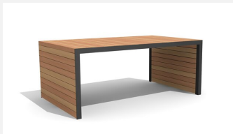
MO.14.32.2 Tisch Linar 200 cm / 120 cm