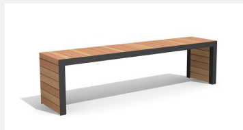
MO.14.22.2 Hockerbank Linar 200 cm / 45 cm