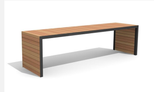
MO.14.31.3 Tisch Linar 300 cm / 80 cm