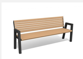
MO.12.01.H Bank Quat - mit Armlehnen Hartholz