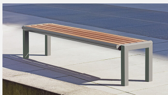
SOPR.035 Hockerbank Qua - Hartholz NEU - Sonderangebot