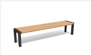
MO.12.03.H Hockerbank Quat - Hartholz