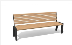
MO.12.02.H Bank Quat - Hartholz