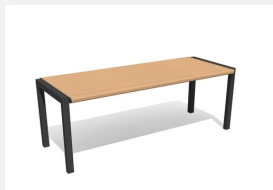
MO.12.04.H Tisch Quat - Hartholz