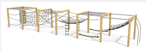
KL.150.6.25 Kletterquader Holz 6, Höhe 250 cm